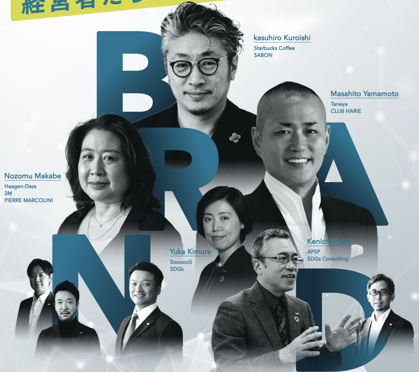
Kasuhiro Kuroishi Starbucks Coffee SABON